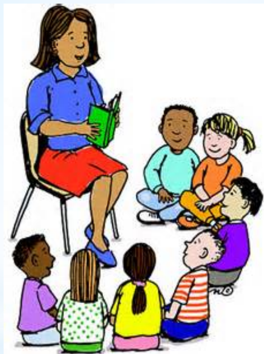
做 アセ 該 コト 做 アセ 的 コト 事 コト 情 シヨウ