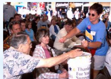
當 タテマテ 義 ギ 工 コウ