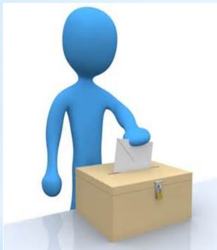
投 ナゲ 票 ヒョウ