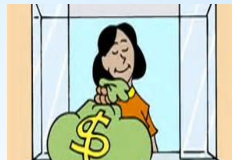
付 ツキ 稅 ゼイ